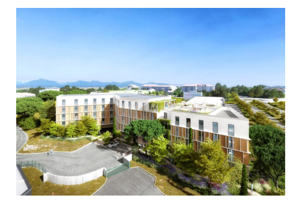
207 rue Albert Einstein 13013 Marseille