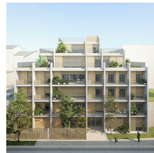
2, passage Saint-Pierre Amelot 75011 PARIS