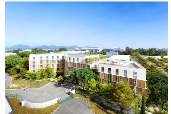
207 rue Albert Einstein 13013 Marseille