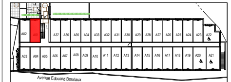
PLAN DU NIVEAU