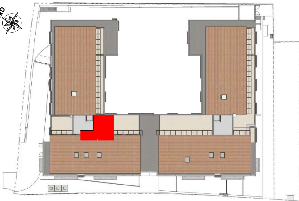
REPERAGE PLAN DE MASSE