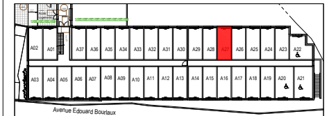
PLAN DU NIVEAU