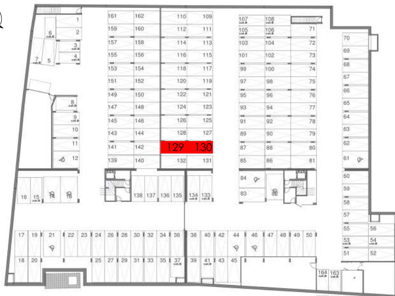
REPERAGE PARKINGS SOUS-SOL