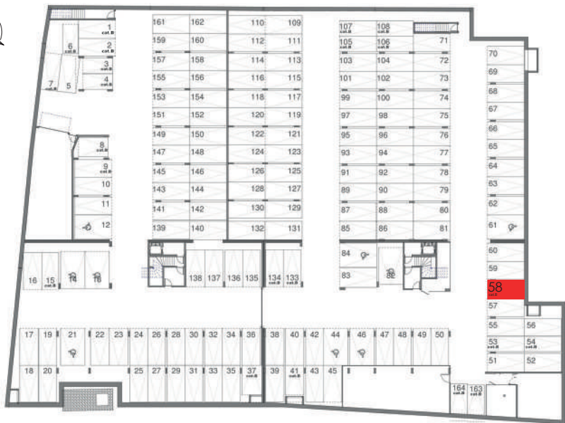
REPERAGE PARKINGS SOUS-SOL