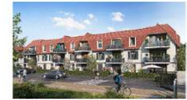
OPERATION BLOOM 90 logements collectifs Rue Henri Robert-Nieu - MAROD EN BAROEUL