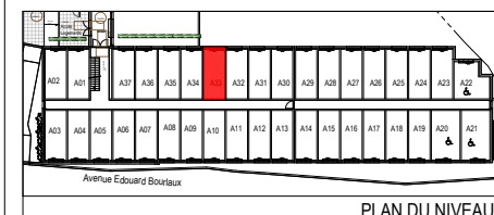
PLAN DU NIVEAU