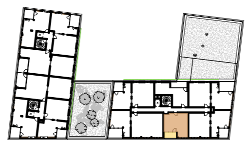
PLAN DE REPERAGE

GROUPE GAMBETTA SCCV GAMBETTA EMMA GRENOBLE 63 Quai Charles de Gaulle - 69006 Lyon png 42 av. Dugueyt Jouvin 38500 Voiron 12 rue Bourgon 75013 Paris