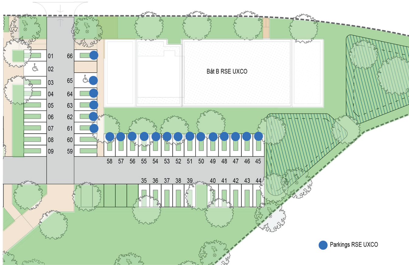
Plan de pré-commercialisation