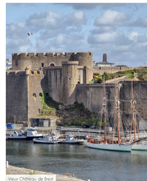
Vieux Château de Brest