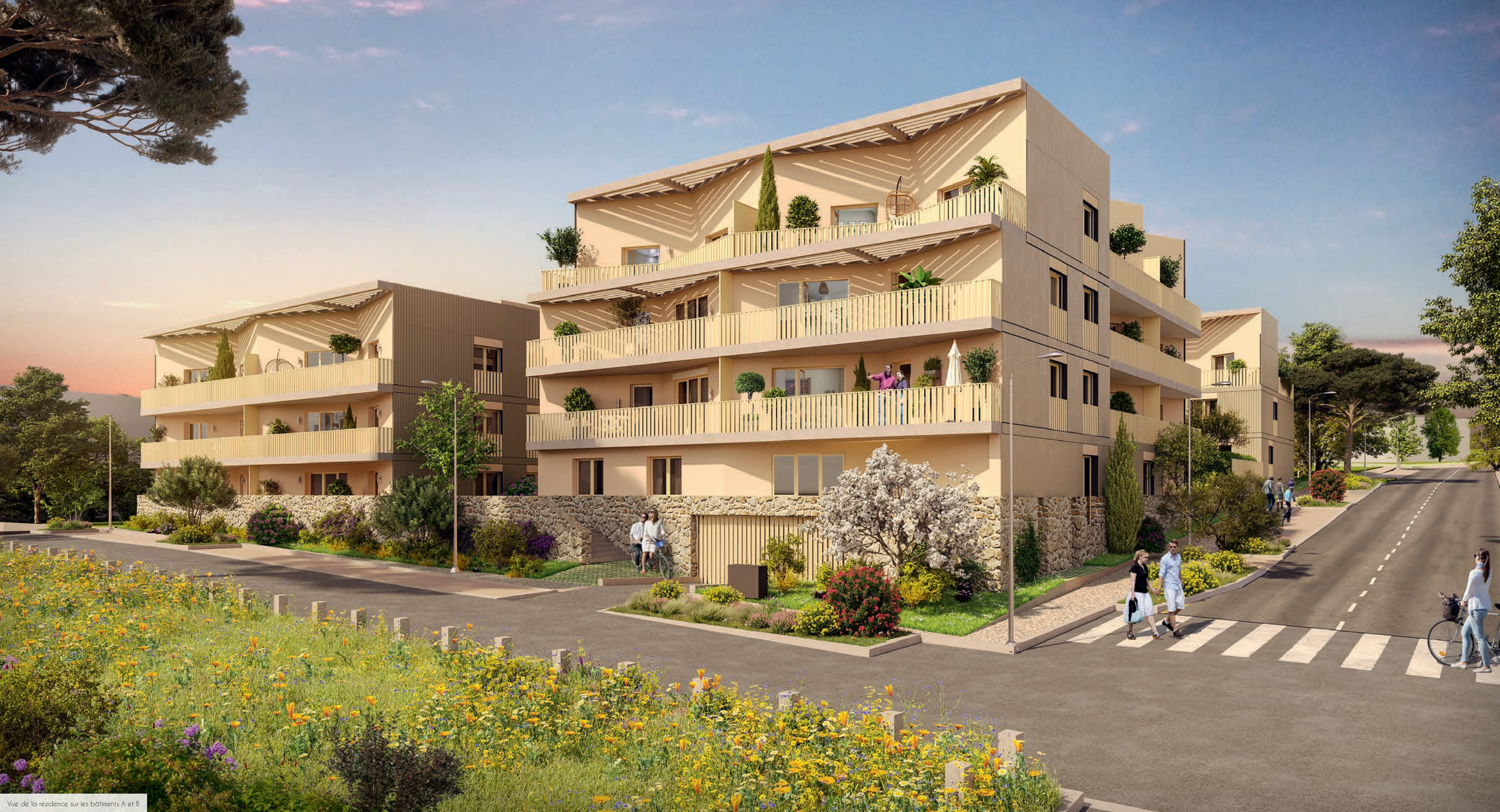
Vue de la résidence sur les bâtiments A et B