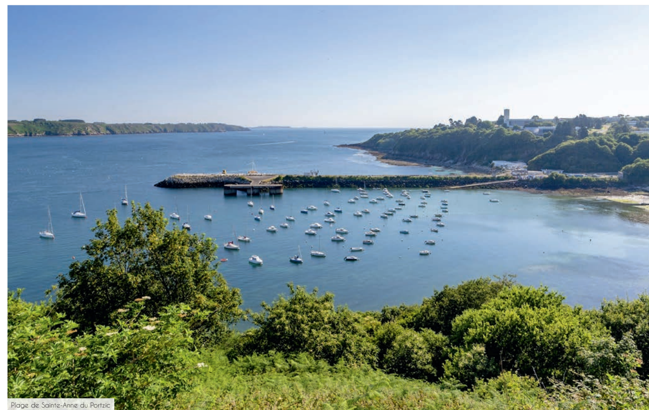
Plage de Sainte-Anne du Portzic